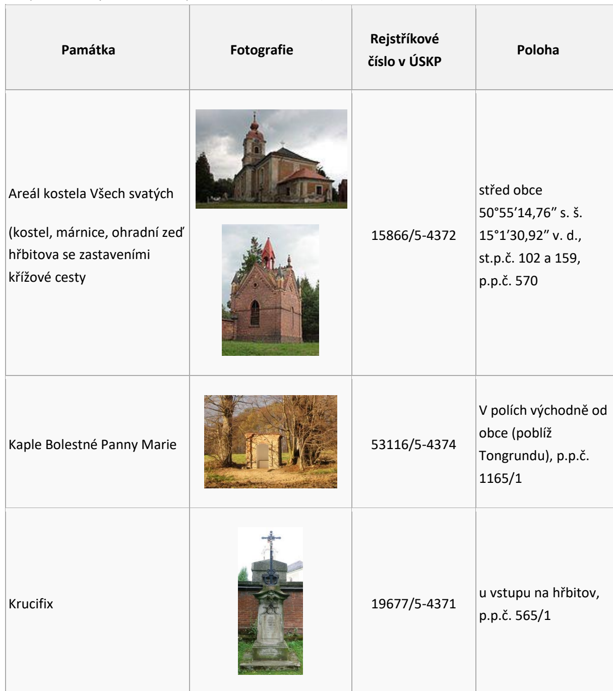
Tab. 3 Objekty zapsané v seznamu nemovitých kulturních památek (zdroj: www.cs.wikipedia.org a Soupis nemovitých kulturních památek okres Liberec )

V území se dále nacházejí objekty místně významné pro vývoj obce. Zejména se jedná o