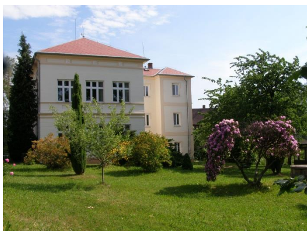
Budova základní školy

Blízkost státní hranice a sousedství s Polskem je vnímáno spíše negativně, projevují se špatné zkušenosti s přeshraniční kriminalitou, nespokojenost s chováním mladých lidí z Polska zejména na koupališti, obavy z dalšího rozvoje elektrárny Turów.