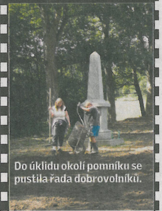
Do úklidu okolí pomníku se pustila řada dobrovolníků.