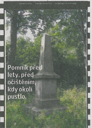
Pomník před lety, před očistením kdy okolí pustlo.