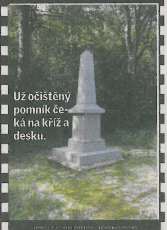
Už očistěný pomník čeká na kříž a desku.