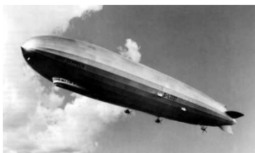
Graf Zeppelin Zdroj: web

Vzducholoď V pondělí dne 25. srpna 1930 o půl jedenácté hodině dopolední byl viděn dosti nízko nad naší obcí „Graf Zeppelin“, jsoucí na svojí vzdušné cestě z Berlína přes Liberec, Prahu a Plzeň do Regensburgu.