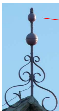
Zdobný bleskosvod na domu č.p. 140 manželů Aloise a Elišky Životových

S novým číslem přichází i nová fotohádkanka. Poznáte co je na obrázku a kde bychom to v obci našli?