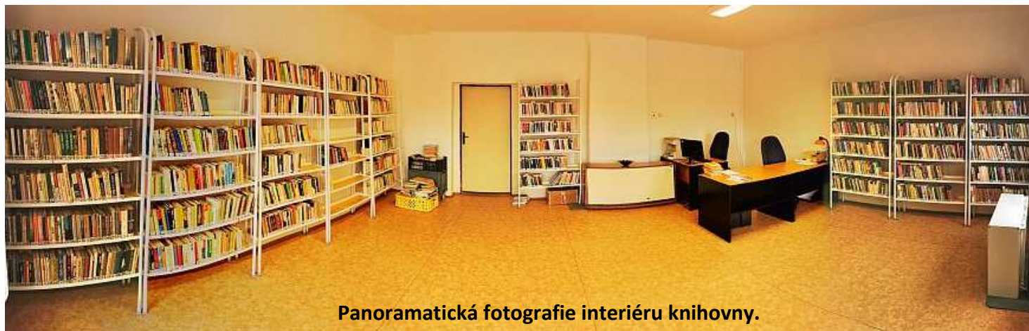
Panoramatická fotografie interiéru knihovny.

Vážení čtenáři, v minulém vydání našeho zpravodaje jsme Vás informovali o opravě místní knihovny. Nyní Vás již můžeme informovat o jejím otevření a zkušebním provozu, který byl zahájen v úterý 4. srpna. Půjčování knih bude probíhat každé úterý v čase mezi 17:30 až 19:30 hodin. Se znovuotevřením knihovny byly aktualizovány i její internetové stránky na adrese https://kunratice.knihovna.cz/ . V menu stránek je umístěn online katalog, v němž si můžete vyhledat knihu Vašeho zájmu, přičemž zjistíte zdali je aktuálně k dispozici nebo je zapůjčená. Je-li kniha volná lze si ji přes tento katalog rovnou i zarezervovat před samotnou návštěvou knihovny. Nuže, milí čtenáři, udělejte si v úterý čas a zavítejte do znovuotevřené knihovny. Velice se na Vás těšíme. MKK