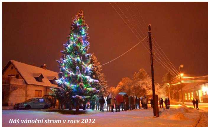
Náš vánoční strom v roce 2012

Řešením neutěšené situace kolem vánočního stromu se zdálo být pořízení nového živého stromu, který by se do parku zasadil. Nutno podotknout, že tato myšlenka není nová a hovořili jsme o ní již v roce 2015, kdy náš vánoční strom utrpěl své zranění. Musím připomenout, že v tomto roce nám ho větrný vír zkrátal cca o 4 metry, když mu ustříhl špičku. Zcela vážně a seriózně jsme se o této variantě začali bavit na zářiovém zasedání zastupitelstva, kde mi byl tento úkol uložen. Začal jsem tedy zjišťovat vše potřebné kolem pořízení a výsadby vzrostlého jehličnanu. Po konzultacích s odborníky, kteří mě vysvětlovali vyhlídky smrků v naší nadmořské výšce (tedy spíše jejich neperspektivu) se jako vhodná volba zdála kavkazská jedle, která se dá sehnat v kořenovém balu od velkopěstitele. To, co jsem však do té doby nevěděl byl fakt, že když si chcete v listopadu zasadit vzrostlou jedli, musíte si ji vyhlédnout a objednat již během letních prázdnin. Narychlo se dají sehnat pouze dražší dřeviny v obřích květináčích za ceny v řádech desetitisíců korun, což jsme v současné situaci zavrhlí. I když opět některé tlapkače hovořili o nákupu stromu, jako o hotové věci. Pravda je taková, že bychom si chtěli v příštím roce nový strom včas vybrat a do parku jej zasadit, aby ve vhodný okamžik převzal štafetu po svém předchůdci a dělal nám radost v následujících letech, na což se upřímně těšíme.